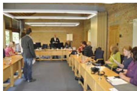
Internt projektmöte i LIFescape där representanter för de åtta partners diskuterar projektet och kommande aktiviteter.