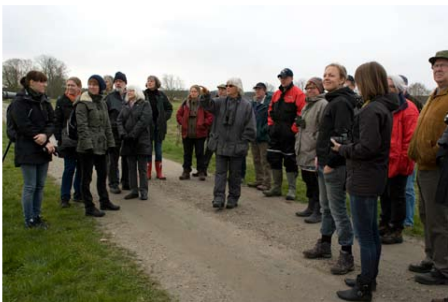
Besök vid storkhägnet Hemmestorps mölla.

Om man nu under sommaren besöker Lunds konsthall kan man se ett antal träd från Veberöds Ljung. De ingår i utställningen "A forest divided" av Henrik Håkansson. Uppgrävandet av träden till utställningen har gjort att det skapats sandblottor vilket i sin tur gynnar ett stort antal hotade insekter. Konsten har därmed bidragit till naturvården. Titeln på utställningen gör också att man kan fundera kring de olika syften en skog kan ha som att ge material till byggnader, ved, papper mm eller som en plats för rekreation och återhämtning eller för naturvärdena i skogen eller något annat. Utställningen pågår till den 2 september.