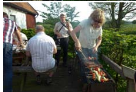
Kvällen bjöd på närbild på leran, kräftor och mat från grillen.