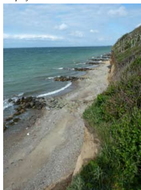
Kusten söder om Korsör där konferensen hölls.