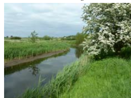
Tudeå i Slagelse kommun.