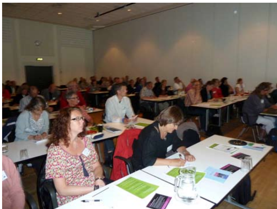
Föreläsningssalen var full när de ca 80 deltagarna hade samlats för den internationella konferensen om brukarmedverkan i Korsör, Danmark.

Information om natur- och kulturlandskapet i Vombsänkan från Lunds- och Sjöbo kommuner samt Länsstyrelsen i Skåne