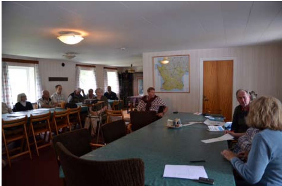
Mötesdeltagarna i Hemmestorpsmölla.

“Världen är som en bok, den som stannar hemma läser bara första sidan” – Augustinus (354-430)