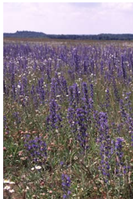
Sandiga marker med blåeld på Revingefältet.