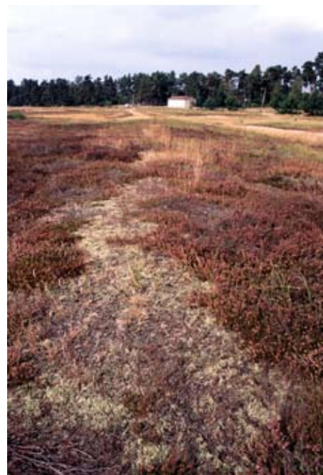
Sandiga marker söder om Regementet.