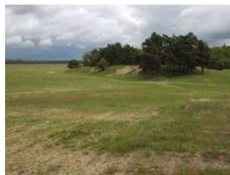
Sandiga marker vid Svarta hål på Revingefältet.