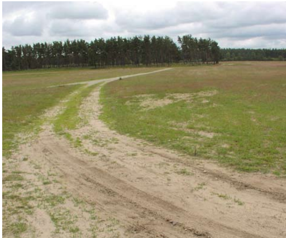
Sandiga marker vid Östra Tvet på Revingefältet

Länsstyrelserna i Skåne, Halland och Kalmar län har, tillsammans med Lunds universitet och Kristianstad Vattenrike, beviljats EU-medel för att restaurera det forna myllrande växt- och djurlivet i de sydsvenska sandmarkerna. Projektet som leds av Länsstyrelsen i Skåne har en budget på 70 miljoner kronor och finansieras till hälften av EU-medel. I Skåne kommer projektet arbeta med 16 olika Natura 2000-områden, däribland Revingehed.