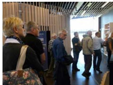
Rundvandring i naturum.