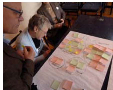
Workshop på Östarps Gästis den 6:e oktober.