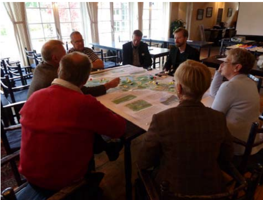
Gruppdiskussion om kvaliteter i Vombsänkan. Östarps gästgivargård 10 oktober 2012.