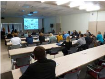
Tredje internationella konferensen i Litauen i LIFEscape 10-11 oktober 2012.