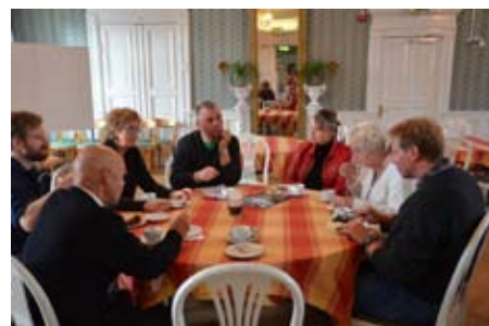
Efteråt bjöds på god fika på Sjöbo gästis.