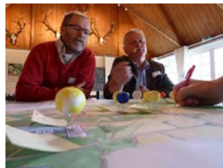
Workshop på Östarps Gästis den 6:e oktober. Foto Per Blomberg.