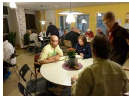
Efter födraget bjöds det på soppa och nybakat bröd.