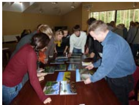
Workshop om delaktighet. Tredje internationella konferensen i Litauen i LIFEscape 10-11 oktober 2012.