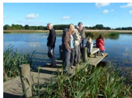
Studiebesök vid Vinnö ångar.