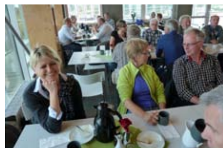
Fika på Fredholms kafé i naturum.