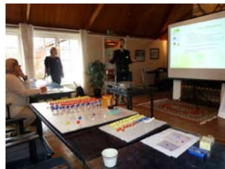
Workshop på Östarps Gästis den 6:e oktober.