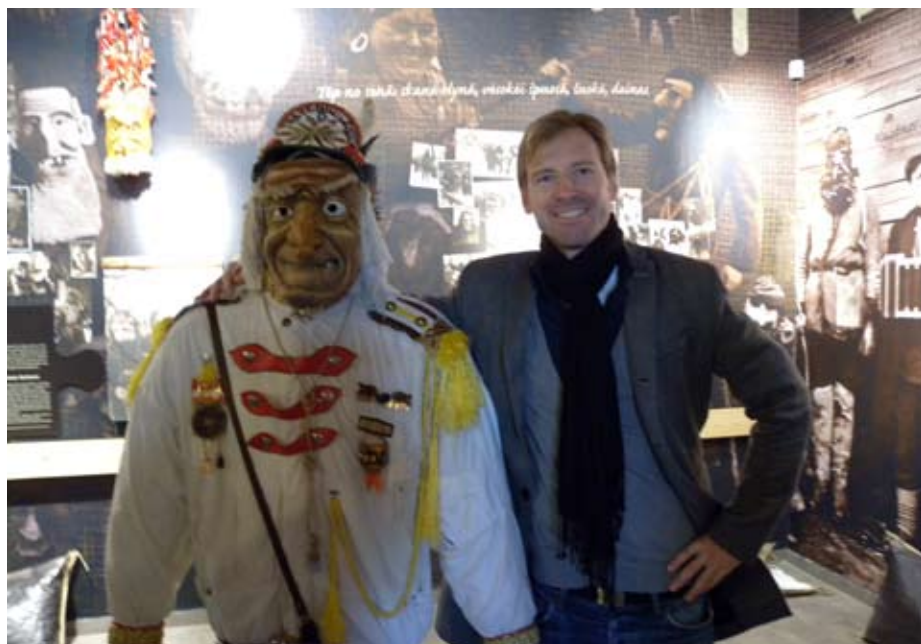
Studiebesök på museet i Zemaitija nationalpark i Litauen. Författaren är till höger.

Information om natur- och kulturlandskapet i Vombsänkan från Lunds- och Sjöbo kommuner samt Länsstyrelsen i Skåne